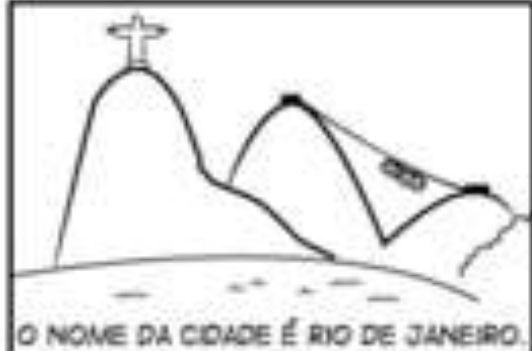
O NOME DA CIDADE É RIO DE JANEIRO.

Gato, menina e cidade são substantivos comuns. Os SUBSTANTIVOS COMUNS dão nome a todos os seres de uma mesma espécie. São escritos com a letra inicial minúscula.