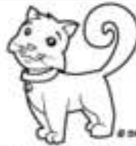
O NOME DO GATO É MIMI.