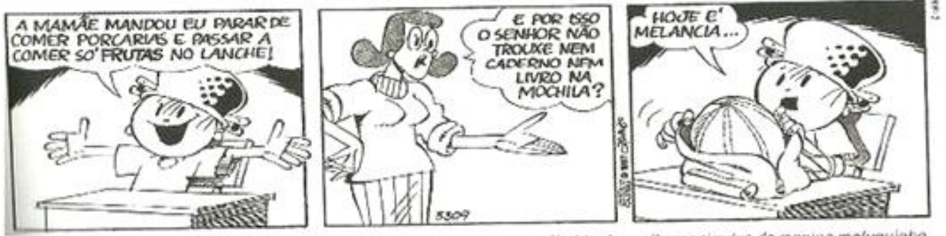
■ Ziraldo. As melhores tiradas do menino maluquinho. São Paulo: Melhoramentos, 2000, p. 57.

2- Leia esta tirinha do Menino Maluquinho.