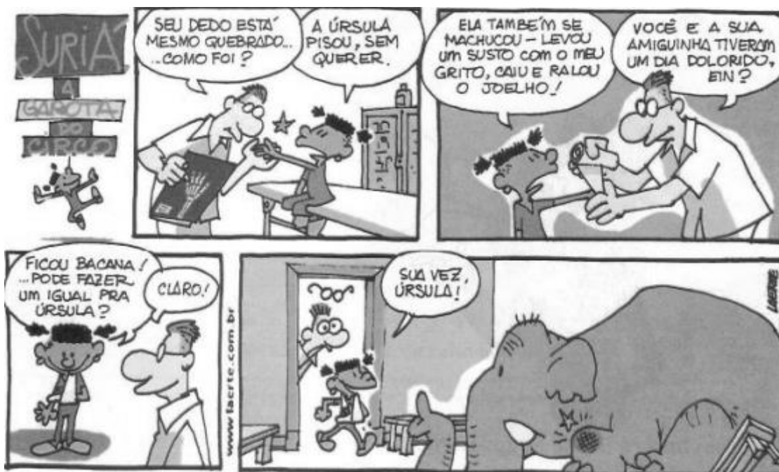
Laerte. Suriá, a garota do circo. São Paulo: Devir/Jacarandá, 2000.

07. As frases abaixo foram retiradas do texto acima. Leia atentamente e marque a alternativa que representar um FATO.