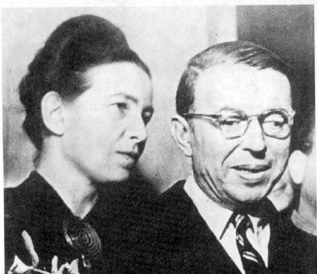
Sartre e sua parceira Simone de Beauvoir. Mantendo uma relação aberta por cerca de 50 anos, eles formaram o casal-símbolo das esperanças libertárias dos tempos modernos.

Sartre traz para o centro de seu pensamento e de sua obra o homem, que é, segundo o filósofo, o único ser "para-si". Toda preocupação de sua filosofia está em pensar o indivíduo concreto a partir de sua existência cotidiana desprovida de qualquer sentido ou relevância especial. A partir dessa condição humana, Sartre elabora o conceito do nada, que se refere à consciência, ou seja, ao próprio homem que não tem em si um sentido ou uma essência a priori determinada, mas consiste tão-somente na possibilidade de fazer a si mesmo a partir de sua livre escolha. Uma vez que é livre e que não traz em si nenhuma predefinição, a consciência é o próprio nada. Para o filósofo, é própria da condição humana a falta de sentido e de determinações. No entanto, se, por um lado, essa falta de sentido pode parecer um problema, por outro, é justamente ela que leva o homem a buscar algo que traga sentido à sua vida, e ele faz isso por meio de suas próprias escolhas, uma vez que é plenamente livre.