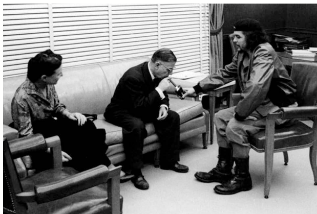
Sartre e sua esposa Simone de Beauvoir em visita a Che Guevara em Cuba.

O pensamento de Sartre ultrapassou os limites da França e se espalhou pelo mundo nas décadas de 1940 e 1950, influenciando consideravelmente a política, os movimentos sociais, as mentes dos intelectuais e a arte. Sartre viajou por todo o mundo, tendo sido recebido por políticos e ativistas famosos, como Che Guevara, em Cuba, e Khrushchev, na Rússia.