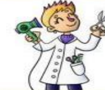
la peluquera el peluquero

Diagnostica y cura enfermedades gracias a sus conocimientos.