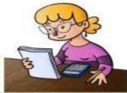
la administrativa el administrativo

Actúa en películas, series u obras de teatro.