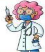
la médica el médico

Repara vehículos (coches, motos...) en un taller.