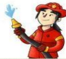
la bombera el bombero

Diseña los planos de un edificio y ayuda a construirlo.