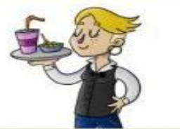
la camarera el camarero

Cobra el dinero de las compras en la caja de una tienda.