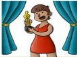
la actriz el actor

Actúa en películas, series u obras de teatro.