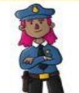
la policía el policía

Informa de noticias a través de medios de comunicación.