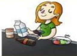
la cajera el cajero

Apaga fuegos o ayuda en emergencias, como en terremotos.