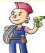
la electricista el electricista

Cuida tus dientes y te ayuda a mantener una sonrisa bonita.