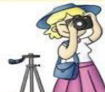
la fotógrafa el fotógrafo

Instala y repara instalaciones eléctricas.