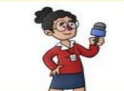
la periodista el periodista

Enseña ciencia, idiomas, arte, técnica... a estudiantes.