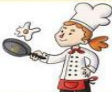
la cocinera el cocinero

Investiga nuevos avances científicos para la sociedad.