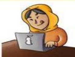
la programadora el programador

Protege a los ciudadanos y hace cumplir la ley.