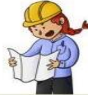
la arquitecta el arquitecto

Trabaja en la administración de una empresa.