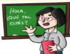
la profesora el profesor

Peina, corta y arregla el pelo de la gente.