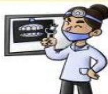
la dentista el dentista

Cocina para otras personas de manera profesional.