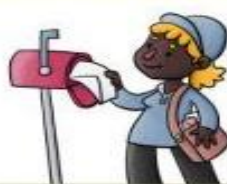
la cartera el cartero

Sirve comidas o bebidas en los locales de hostelería.