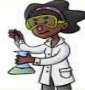
la científica el científico

Reparte cartas o paquetes por la ciudad.