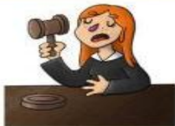
la jueza el juez

Juzga y declara culpables o inocentes a las personas.