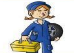
la mecánica el mecánico

Juzga y declara culpables o inocentes a las personas.