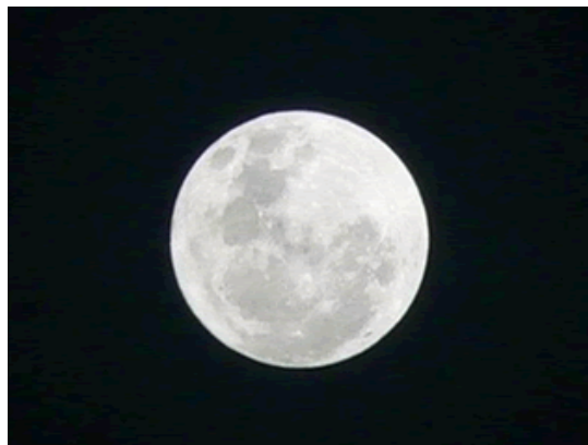
A Lua cheia é a fase mais brilhante

Esse fenômeno ocorre em razão do ângulo em que observamos a face da Lua iluminada pelo Sol. Cada fase da Lua tem duração de aproximadamente sete dias, influenciando nas marés e em alguns hábitos, como cortar o cabelo, pescar, entre outros.