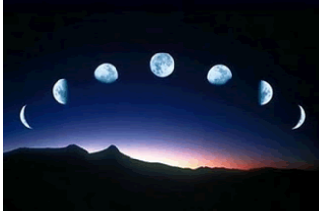
As fases da Lua são: cheia, minguante, nova e crescente

1- Observe as imagens e nomeie-as de acordo com a fase da Lua que representam: