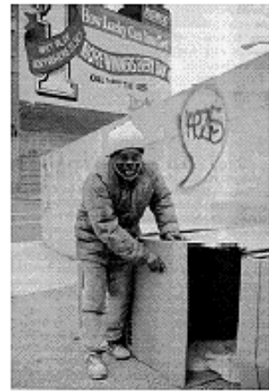
Sem-teto em Nova York (EUA)

Escreva duas justificativas para a existência desses espaços urbanos.