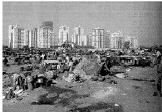
Marlman Point, em Mumbai (Índia)