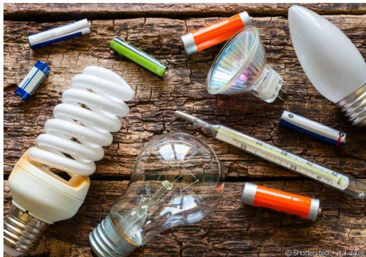
Fluorescentes y pilas