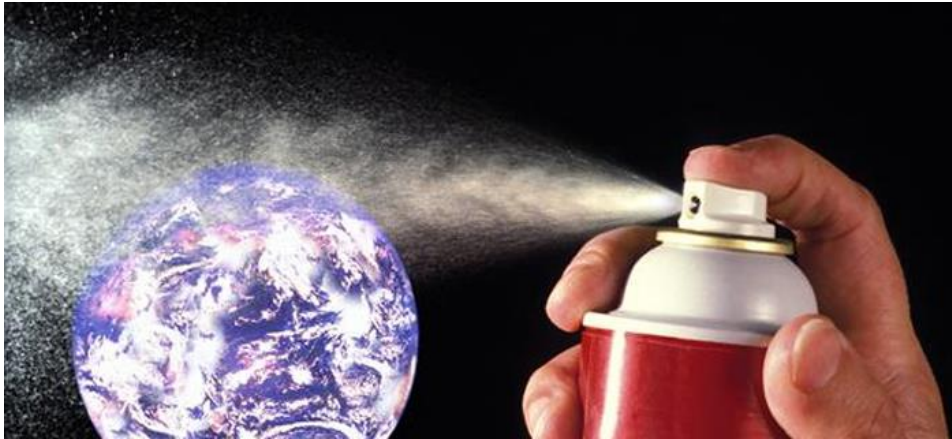
Llamados de Aerosoles y spray, también catalogados como Pulverizadores