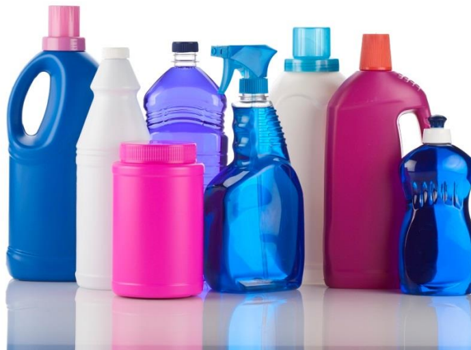
Detergentes y productos de limpieza