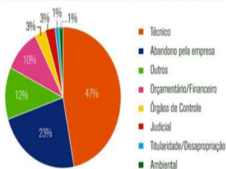
Principais motivos para a paralisação das obras, segundo o TCU