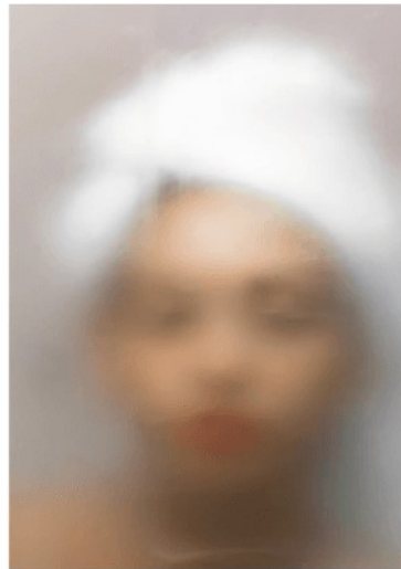
BOX DE BANHEIRO TRANSLÚCIDO