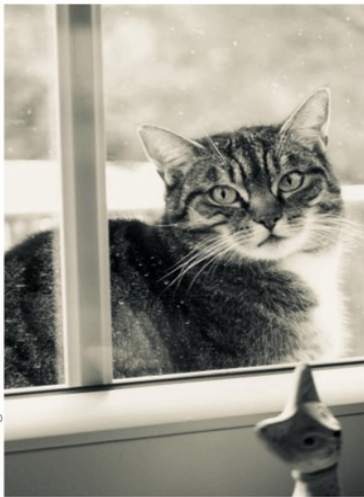
VIDRO DE JANELA TRANSPARENTE

Diferentes superfícies determinam como a luz pode passar ou não por elas: