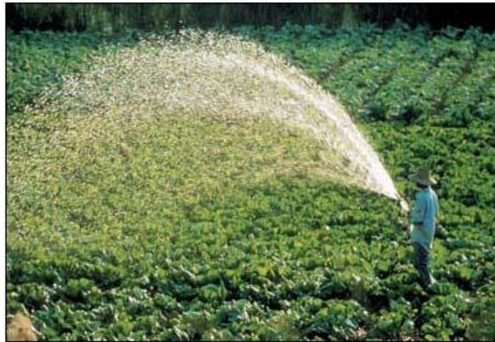
Uso da água na irrigação

Segundo a página Planeta Orgânico, atualmente, cerca de 3600 km 3 de água doce são utilizados para uso humano – o equivalente a 580 m 3 per capita por ano. O quadro abaixo mostra que, em todas as regiões, exceto Europa e América do Norte, é na agricultura que se usa maior quantidade de água, responsável no mundo todo por aproximadamente 69% de todo o gasto. A utilização para fins domésticos conta com 10% e a indústria consome 21% da toda a água retirada.